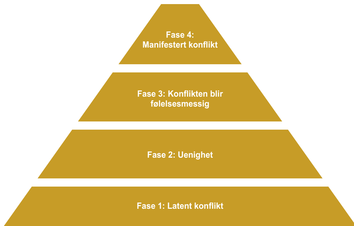
Figur 1. En firedelt modell for eskalering og beskrivelse av konflikter (se kapittel 10).

Denne modellen er benyttet som utgangspunkt for de spørsmålene barnevernsarbeiderne er stilt og vi kan derfor kategorisere svarene deres slik at de teoretisk sett forteller oss noe om hvor alvorlig konflikten opplevdes og hva som karakteriserer den, se tabell 3. Når de ansatte i barnevernstjenesten ble bedt om å ta utgangspunkt i den siste høykonfliktsaken de hadde ansvar for og krysse av for de beskrivelsene de synes var treffende for denne situasjonen slik de opplevde det, finner vi at henholdsvis få av sakene (7%) eskalerer til nivå 4 hvor samarbeidet bryter sammen og den ansatte ikke lenger kan være saksbehandler i saken. Det er likevel en fjerdedel (25%) som opplevde at det var åpen fiendtlighet mellom dem og foreldrene, noe som kan føre til destruktiv aktivitet og dårlig problemløsning. Det er videre liten tvil om at konfliktsakene når et nivå hvor sakene blir personlige og følelsesmessige, hvor mellom 31-41% av de spurte barnevernsarbeiderne karakteriserer konflikten på en slik måte at konflikten befinner seg innenfor fase 3.